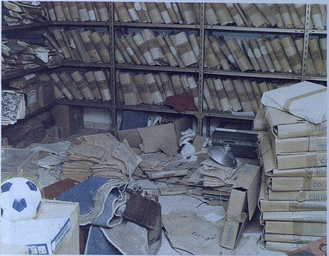
ESTADO DEL ARCHIVO ANTES DE SU ORGANIZACION. FEBRERO - 1985