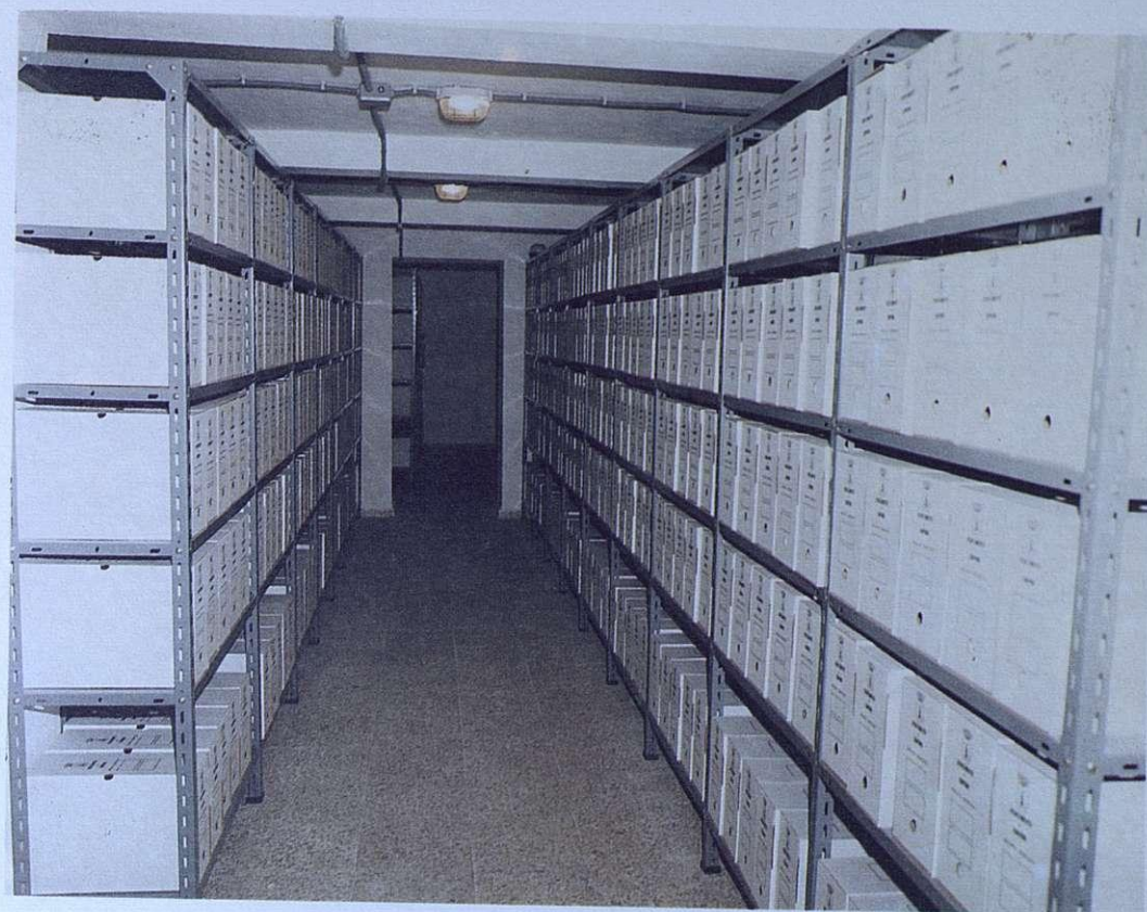
ESTADO DEL ARCHIVO ORGANIZADO. MARZO - 1986